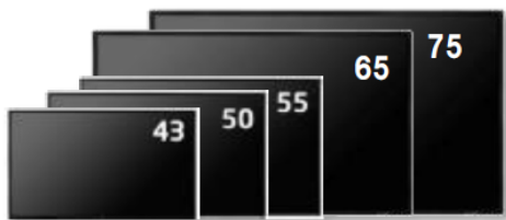
NECパブリックディスプレイ