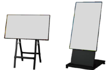
各種ディスプレイスタンド